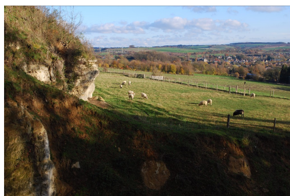
Doelkesberg, in Valkenburg

Natuurmonumenten staat als partner aan de lat voor de verwerving van 29 ha grond in het Life project. Een eerste grote slag is binnengehaald met de aankoop van 11,6 ha grond uit een grondruil in de herverkaveling Mergelland Oost. Op dit moment worden de terreinen geïnventariseerd en in 2016 voor de eerste keer benut worden in het project.