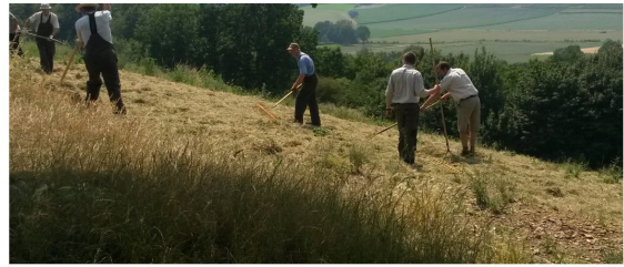
Vrijwilligers van Natuurmonumenten aan het werk

planning gemaakt zodat vaker en eerder maaiwerk kan plaatsvinden. Naast het machinale werk zijn ook de restant hoeken echt moeilijke locaties met behulp van vrijwilligers gemaaid en ook geent met maaisel.