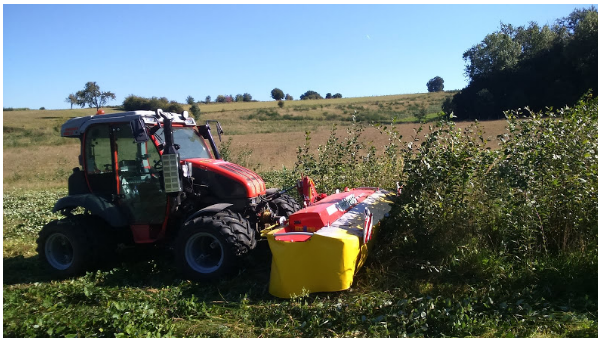
De Mounty 100V.

Deze zomer is de Mounty – het eerste exemplaar op Belgische bodem - al uitgebreid ingezet voor het herstel- en hooibeheer van onze hellingsgraslanden. Het werken met de Mounty vergt enige oefening maar wanneer men ermee vertrouwd is wordt het werken een genot en zijn de mogelijkheden verrassend groot. De komende jaren zullen we deze kwaliteiten nog verder ontdekken en de beheerde terreinen in hun glorie herstellen !